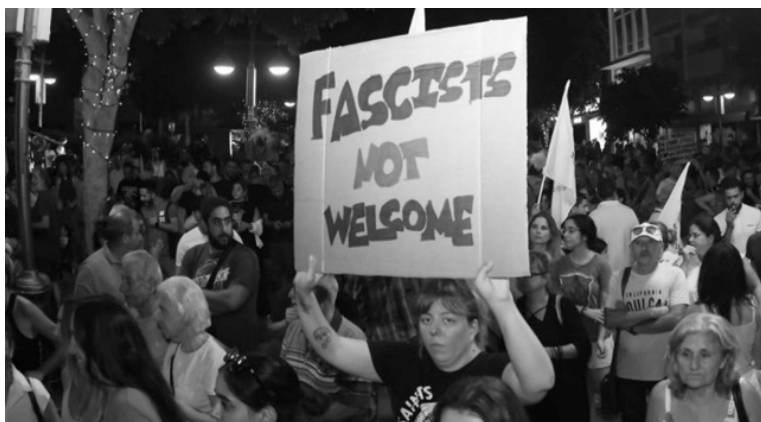
Πλακάτι «Fascist not welcome» στο διοικητήριο Λεμεσού

Η ατμόσφαιρα καταδίκης που επικράτησε λόγω των μαζικών πορειών αλλά και του γενικότερου κοινωνικού και πολιτικού κλίματος που επικρατούσε, κατάφερε να αντιστρέψει την κοινωνική νομιμοποίηση που είχαν πριν οι φασίστες. Τις ακριβώς επόμενες μέρες του πογκρόμ στην Λεμεσό, το κλίμα καταδίκης προς τους φασίστες αλλά και κινήσεις αλληλεγγύης προς μετανάστες και μετανάστριες, διογκώθηκε τόσο με τις πορείες, όσο και με διάφορα «gofundme» για αποκατάσταση ζημιών στα μαγαζιά που έσπασαν,[21] με αποτέλεσμα να ακυρωθεί στην πράξη το κάλεσμα των φασιστών να επεκτείνουν το πογκρόμ και στην Λευκωσία, που είχε ανακοινώσει η φασιστόσελιδα «Μαζικές Απελάσεις ΤΩΡΑ».[22]